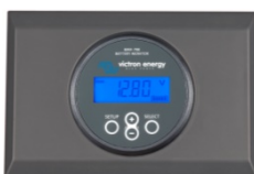
2 Gehäuse für BMV Batteriemonitor oder MPPT Control