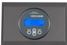
2 Enclosure for BMV battery monitor or MPPT Control