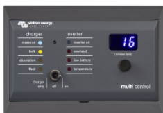
1 Enclosure for 65 x 120 mm GX panels