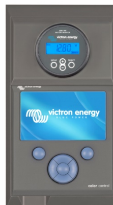
4 Gehäuse für Color Control GX und eine BMV- oder MPPT-Steuerung (nimmt auch ein VE.Net Blue Power Panel GX auf)