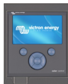
3 Gehäuse für Color Control GX (nimmt auch ein VE.Net Blue Power Panel GX auf)