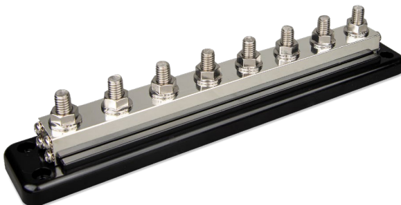
Sammelschiene 600 A mit 8 Hochstromklemmen und 8 Niederstrom-Schraubklemmen, ohne Abdeckung