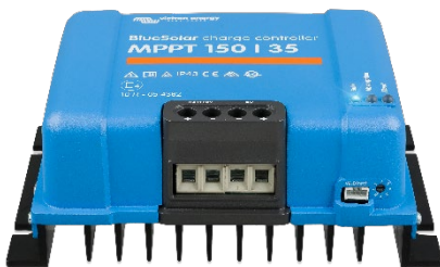
Solar Lade-Regler MPPT 150/35